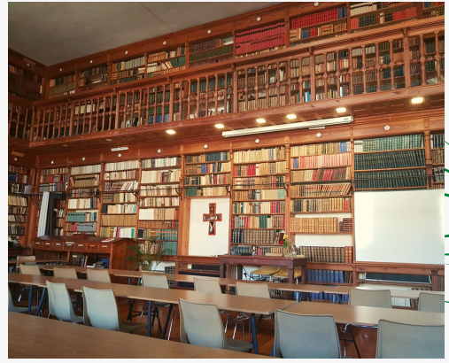
La biblioteca, lieu des enseignements