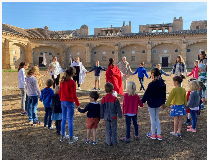
Le weekend, nous organisons des grands jeux pour les enfants !

Voici ma "frat" ! = petit groupe intergénérationnel où l'on partage ce que nous vivons, pendant ce temps de formation. C'est l'occasion de belles discussions et partages !