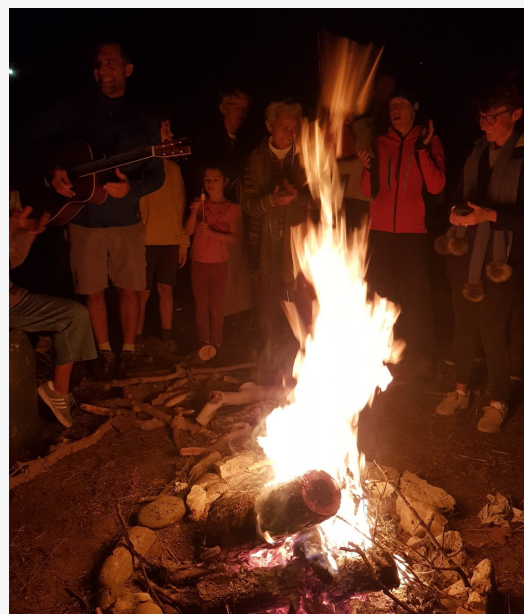
Petite veillée chants et chamallow grillés

Voici la promo de cette année ! Nous avons pu nous retrouver une semaine en France en septembre avant de rejoindre l'Espagne avec certains, les autres sont à Hautecombe en Savoie pour la même formation.