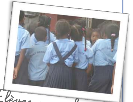
Elèves en uniforme