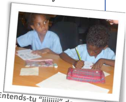
Entends-tu "iiiiiii" dans souris ?