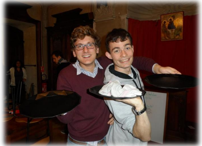
Chiffonnade de torchon accompagné de son rien du tout !

20h45-22h15 : veillée (travail, groupe de prière, désert, partage en fraternité, détente)