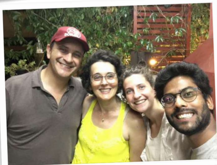
Repas chez une famille brésilienne