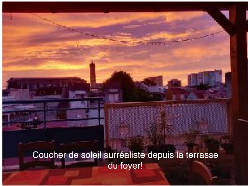
Coucher de soleil surréaliste depuis la terrasse du foyer!