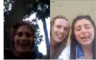
Visio aux quatre coins du monde avec quelques JET ! La joie était présente !