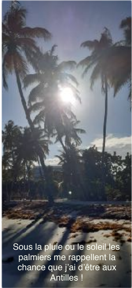
Sous la pluie ou le soleil les palmiers me rappellent la chance que j'ai d'être aux Antilles !