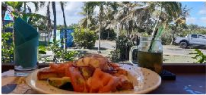
Samedi repos/ évasion avec soeur Odile nouvelle responsable du foyer !