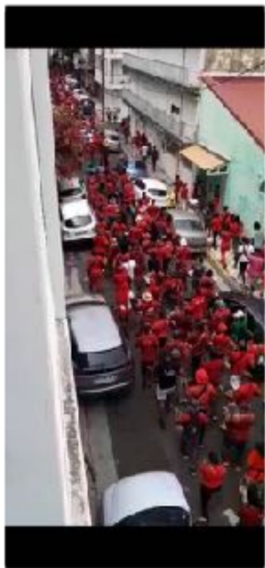
Défilé dans la rue du foyer pour fêter l'abolition de l'esclavage en Guadeloupe le 27 mai !