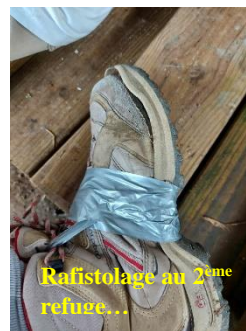
Rafistolage au 3 me refuge...