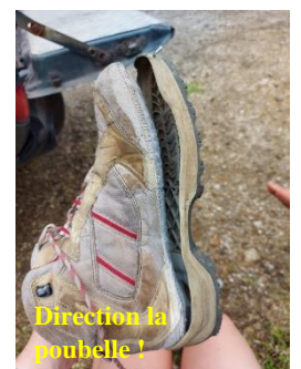
Direction la poubelle !