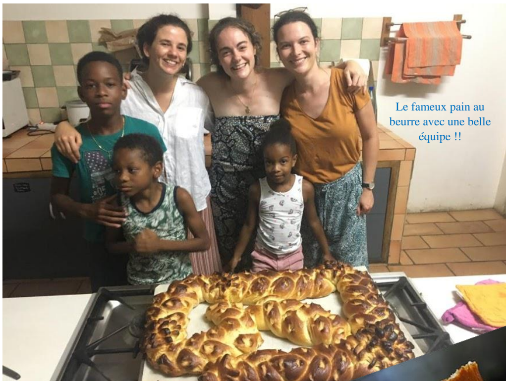
Le fameux pain au beurre avec une belle équipe !!