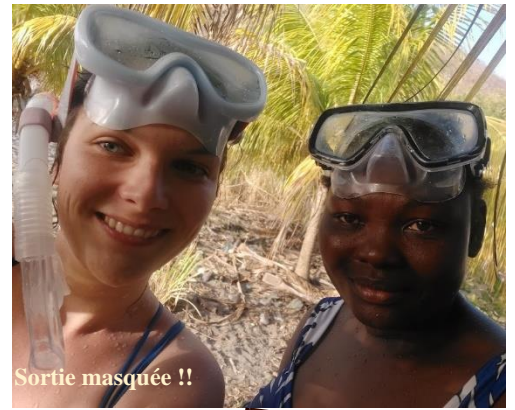
Sortie masquée !!