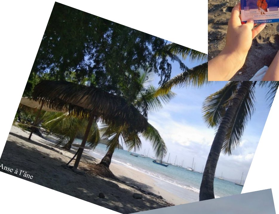
Anse à l'âne