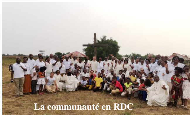
La communauté en RDC

Chaque année, tous les membres de la communauté du Congo : frère/sœurs consacrés et familles se retrouvent à Menkao pour vivre une semaine ensemble. Le but est de tous se retrouver pour partager sur les missions de chacun, faire un point sur l'année et celle qui débute, et vivre un temps de fraternité. Pendant ce temps, une petite équipe dont je faisais partie, s'occupait des enfants âgés de 6 mois à 18 ans. Ça demandait d'être créatif car il y en avait une cinquantaine tous très heureux de se retrouver et du coup très énergiques ! Il