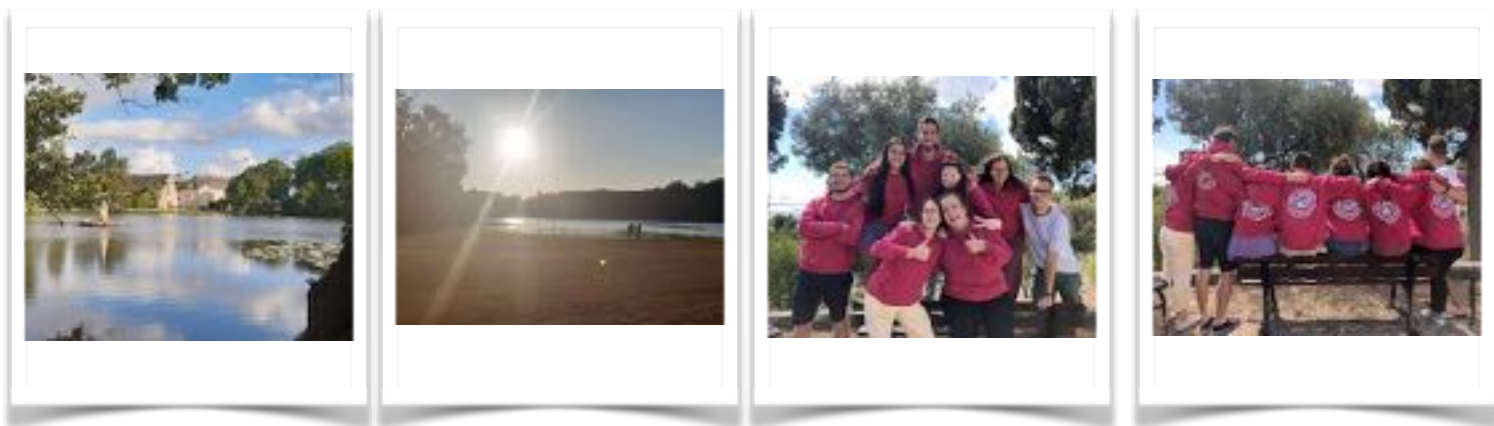
L'atterrissage à Melleray et Marseille

La dernière étape d'atterrissage fût le weekend retour JET avec tous ceux partis mon année qui avaient déjà reposé les pieds en métropole. Un weekend à Marseille rempli d'anecdotes de nos pays, de nos missions et surtout de retrouvailles. C'était également l'occasion de témoigner aux JET de cette année qui étaient à la veille de leur départ pour leur lieux de formation! Rendre grâce ensemble pour les joies et partager les difficultés avec d'autres qui ont vécu la même aventure communautaire m'a fait beaucoup de bien ! Un nouvel envoi dans la reprise des études et la vie presque normale à jamais transformée par ce que j'ai vécu !