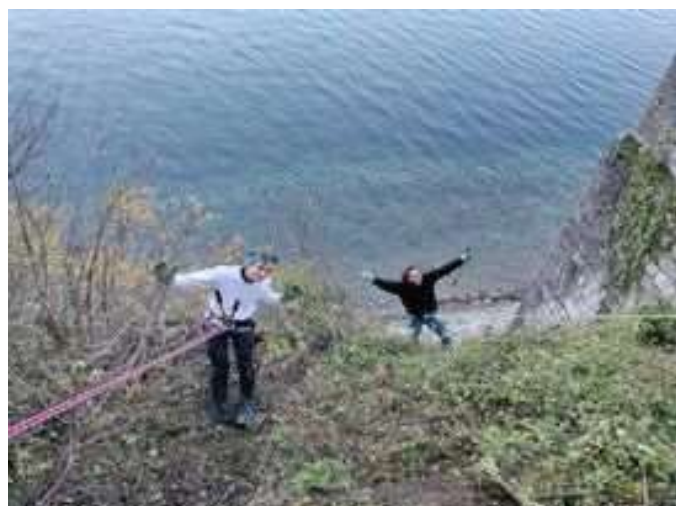
La fameuse descente en rappel pour couper les arbres