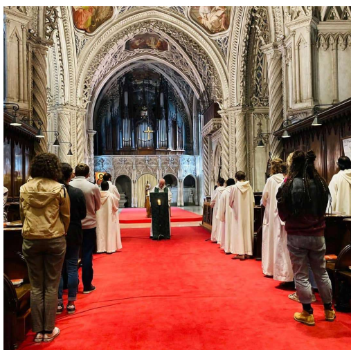
L'intérieur de l'abbaye pendant une messe