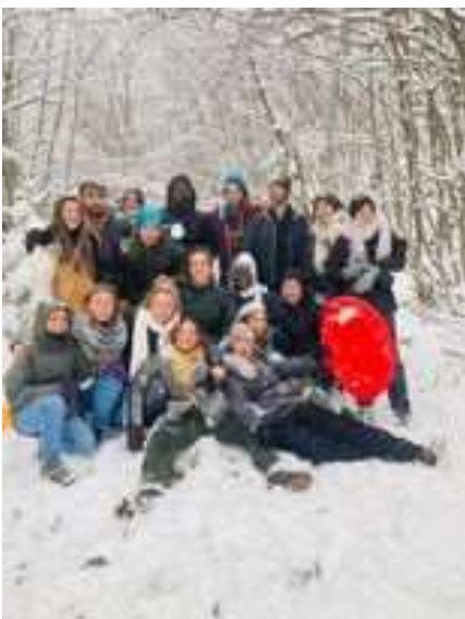
Balade et grosse bataille de boules de neige (c'était même la guerre !)