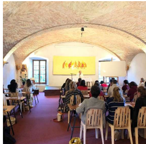
Notre salle de cours