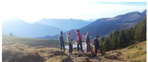
Le lac du Bozon

Au début de HDS, nous sommes partis en weekend de frat à la montagne. Nous sommes allés au lac du Bozon et étions un peu déçus par sa petitesse. Et puis la voiture est tombée en panne. De ces deux événements, nous avons créé une super chanson de frat ( dites-moi si vous voulez que je vous envoie la vidéo ) !