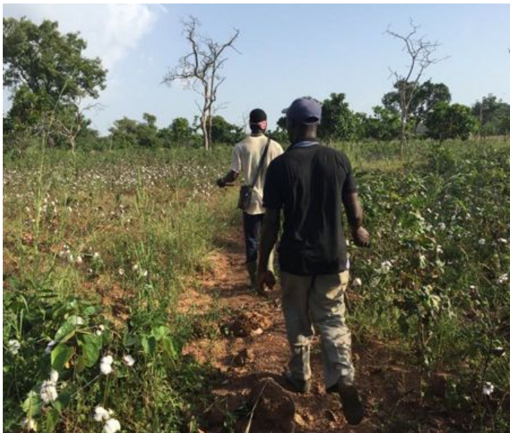
Au milieu des champs de coton...