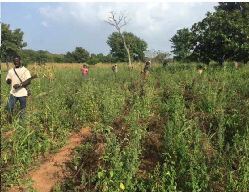
... et d'arachides !