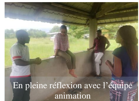
En pleine réflexion avec l'équipe animation

Cette semaine, en participant à cette sous session, je l'ai beaucoup mieux vécue car du temps m'était accordé à la prière et je sentais que le Seigneur était réellement présent à mes côtés.