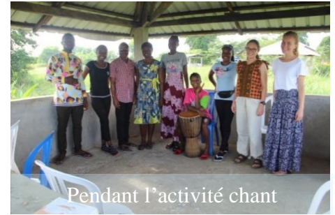
Pendant l'activité chant

De quoi être bien occupée durant ces 6 jours !