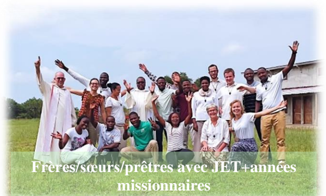
Frères/sœurs/prêtres avec JET+années missionnaires

Deux fois dans l'année, les célibataires consacrés de la communauté ainsi que les JET/années missionnaires se retrouvent ensemble à Menkao