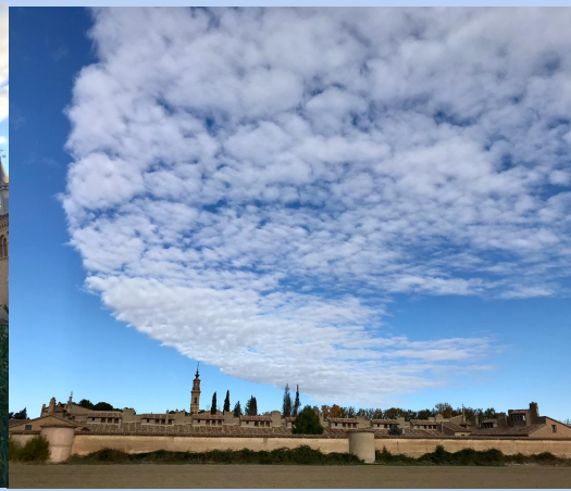
La Cartuja vue sous plusieurs angles: vue sur le clocher, sur la cour d'honneur et depuis l'extérieur