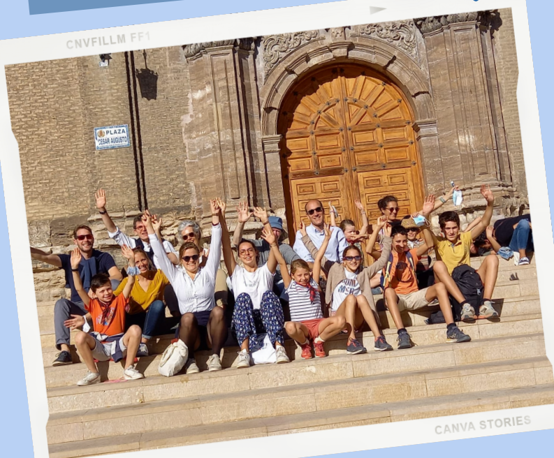
Photo en fraternité, lors de la fête du Pilar, une fête religieuse très importante en Espagne.

Un aspect important de la vie à la Cartuja, c'est ce fonctionnement des fraternités. Nous sommes répartis en petits groupes avec lequel nous vivons des temps de repas, de partage et de service. Une semaine au début de la formation est consacrée à la fraternité: c'est une semaine où nous passons beaucoup de temps avec notre frat' à partager autour de notre Foi et notre histoire. Ce fut une semaine très intéressante où les liens se sont particulièrement resserrés entre nous.