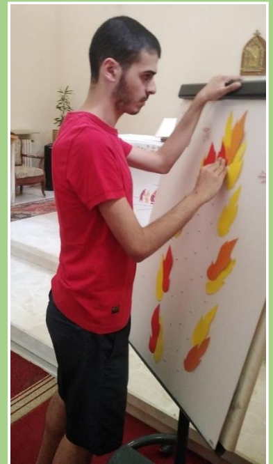
Ici il construit le feu de l'Esprit Saint lors du grand jeu de Pentecôte.

J'essayais de lui imposer les activités au début, en lui proposant par exemple un dessin à recopier sur Paint. Mais il m'a appris que le laisser libre était plus efficace car il fait tout seul un dessin sorti de son imagination, de bien meilleure qualité qu'en en recopiant un.