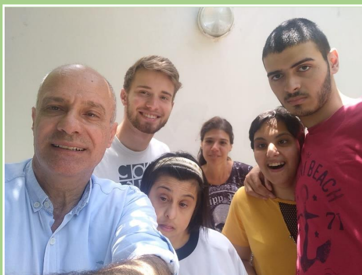
Petit selfie avec une équipe de l'EPES, j'aime beaucoup leur sourire souvent présent

J'espère que tout se passe bien pour vous. J'ai déjà passé plus de la moitié de mon séjour au Liban et je me laisse toujours porter dans ma découverte du pays et de sa culture. Je me sens bien intégré dans le pays bien que je ne sois pas encore bilingue Libanais ! Le sens de l'accueil, le partage des bonnes choses et la franchise que je trouve dans le pays me correspondent très bien.