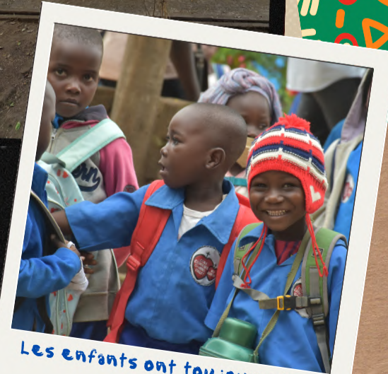
Les enfants ont toujours le sourire ici !