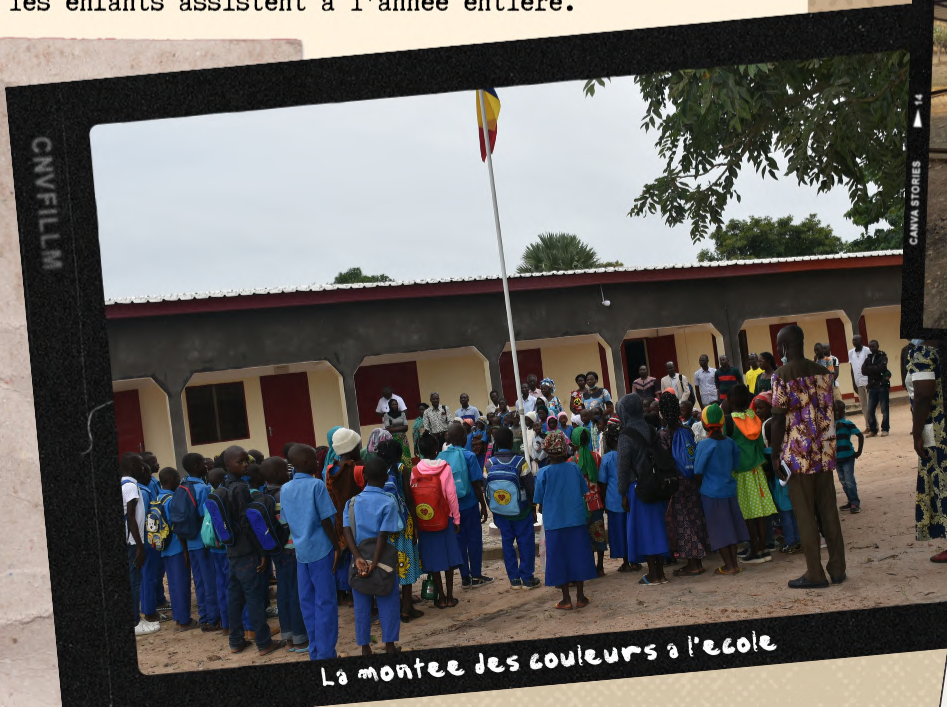
La montée des couleurs à l'école