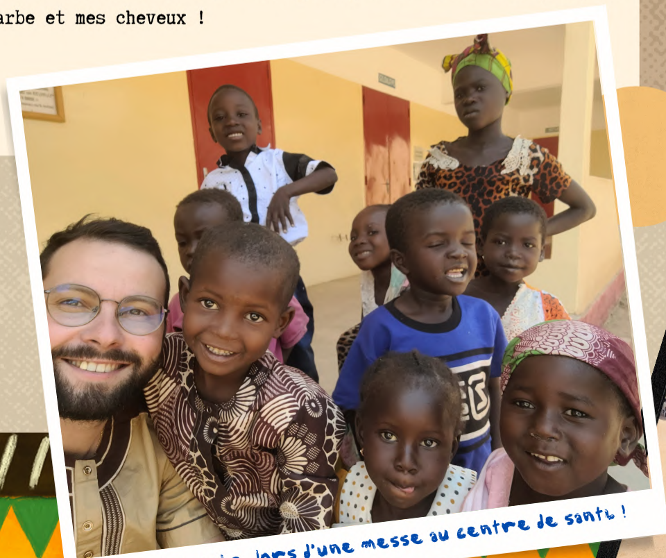
Un dimanche, lors d'une messe au centre de santé !

Etre au service à l'école est une très belle occasion de parler, jouer et de passer du temps avec les enfants, qui même très pauvres sont très joyeux et gardent le sourire. C'est une belle leçon de vie ! Ci-dessous, nous étions au centre de santé pour une messe célébrée par l'Evêque, au profit des malades. Les enfants étaient très intrigués par ma couleur de peau, ma barbe et mes cheveux !