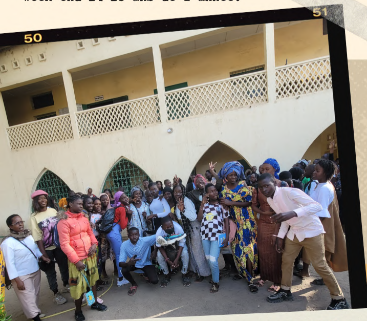
Les jeunes étaient très contents du W-E !

Cette première semaine a été riche en bousculements culturels. Savoir que la culture Tchadienne et africaine est différente de la nôtre est une chose, être immergé dedans en est une autre. C'est une réalité très dure et tellement différente, pour moi, européen qui ai accès à tout, et sans limite. Cela m'a rappelé combien la vie est précieuse, qu'il faut en prendre soin. Prendre soin de nos relations les uns avec les autres aussi.