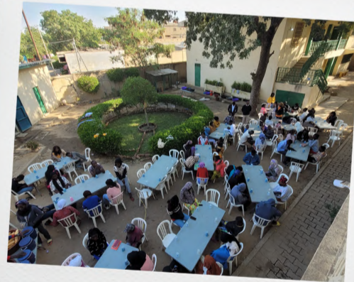
Le week-end I4-I8 au puits de Jacob, N'Djamena

J'ai tout de suite été volontaire pour animer le premier week-end I4-I8 ans de l'année.