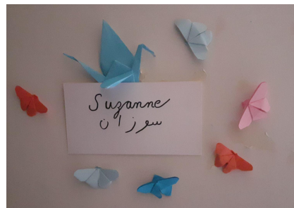
Mot d'accueil sur la porte de ma chambre