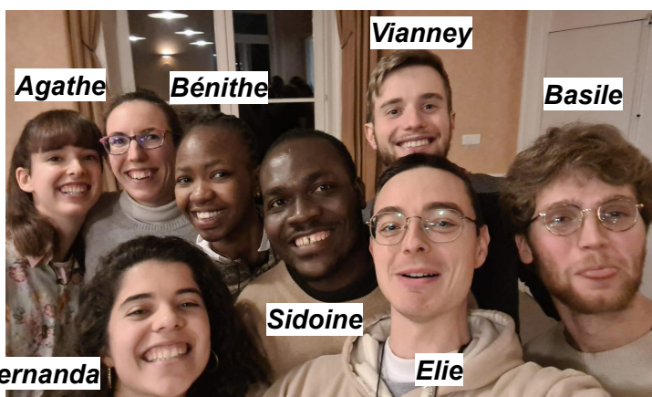
La team HDS au service de Jéricho !

Direction le monastère de Bouvines, près de Lille, du 30/12 au 06/01. J'y ai retrouvé des personnes de la communauté venant de Lille, Reims et Nancy, d'autres jeunes au service et notamment une fine équipe d'Hautecombe ! Quelle joie de découvrir de nouvelles têtes et de retrouver certains de ceux avec qui j'ai passé les 3 derniers mois. Tous ensemble, nous avons porté cette session dans le service et la prière, pour que chaque participant se sente accueilli et puisse faire l'expérience de l'amour de Dieu.