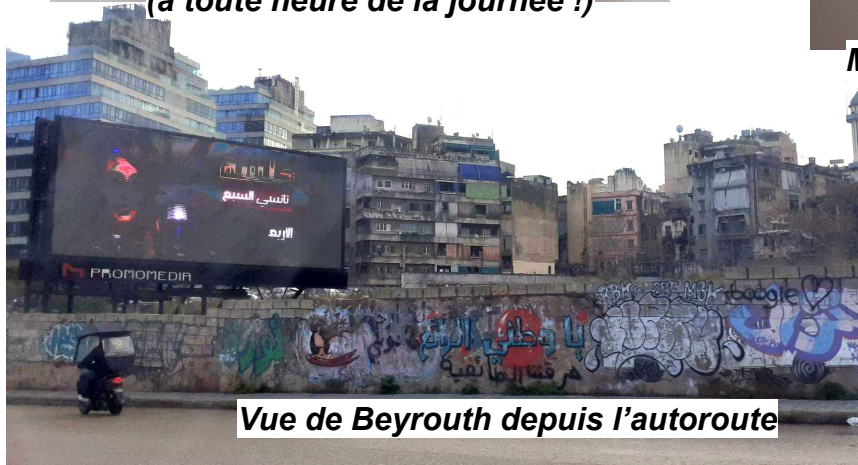
Vue de Beyrouth depuis l'autoroute