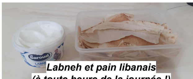
Labneh et pain libanais (à toute heure de la journée !)

Beaucoup de choses à découvrir et à vous partager dans les prochaines JET News !!