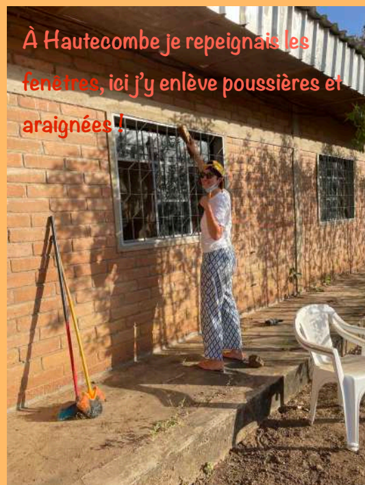
À Hautecombe je repeignais les fenêtres, ici j'y enlève poussières et araignées !

La vie ici est rythmée entre différents temps comme à Hautecombe : temps de prière (laudes, prière personnelle, Eucharistie et Adoration quotidiennes), de missions, de services auprès de la maison, temps de repos (ma sieste est indispensable pour tenir la chaleur) !