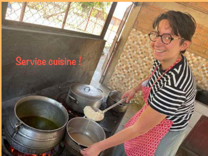
Service cuisine !