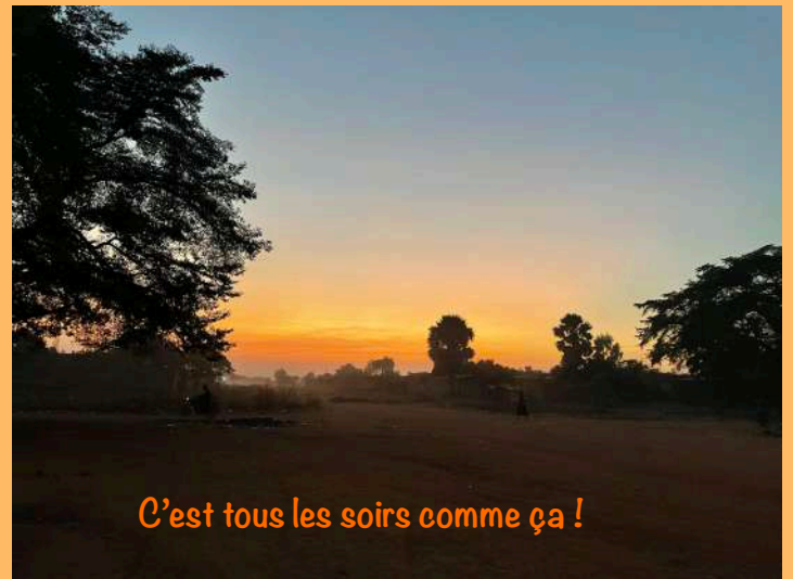
C'est tous les soirs comme ça !