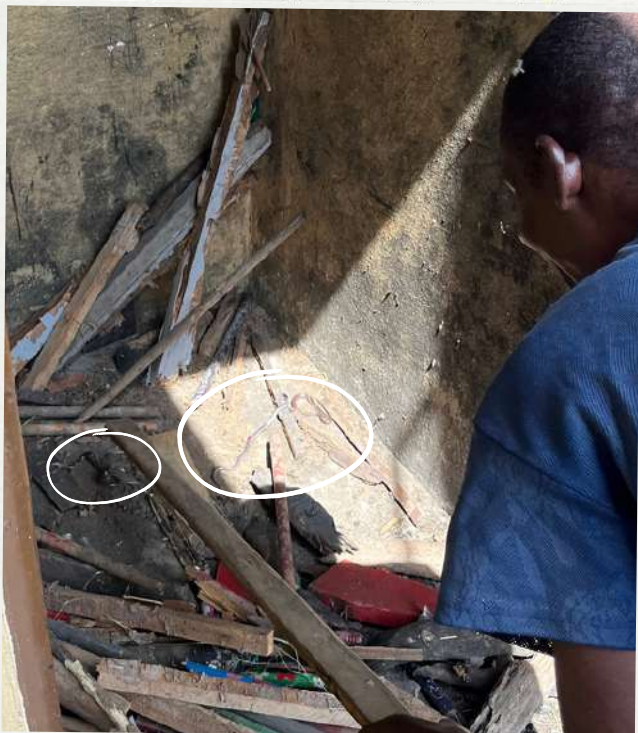
Le jardinier en train de tuer trois serpents à la communauté.