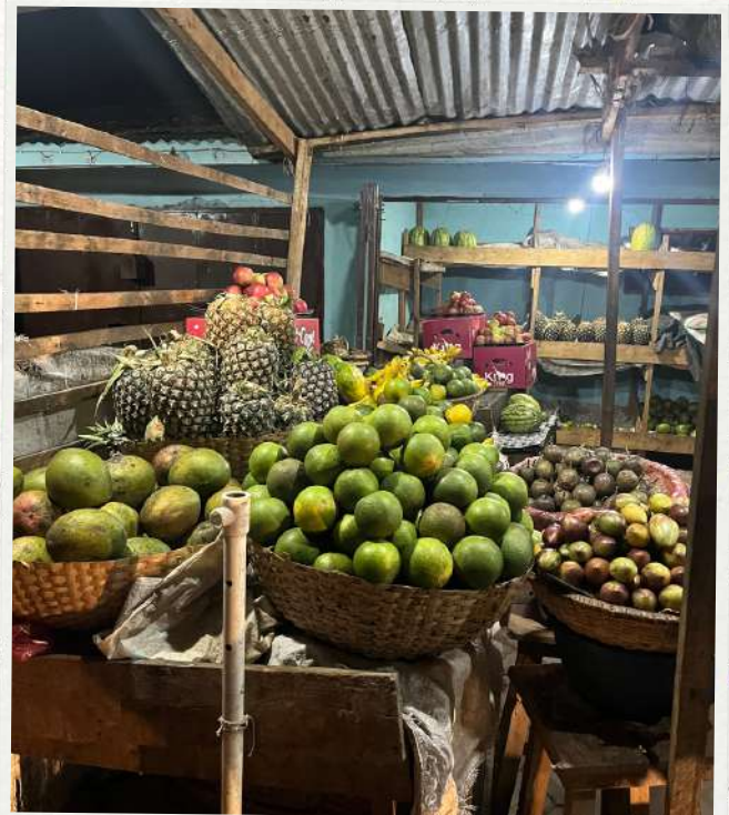
Les étalages de fruits... je vous disais que c'est le paradis tous ces fruits !