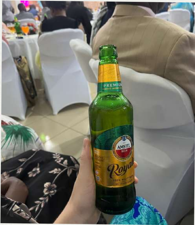
Primus, Royale, Amstel ou Bock, Les bouteilles de bières ici sont hyper grandes! C'est l'équivalent d'une pinte... en bouteille !