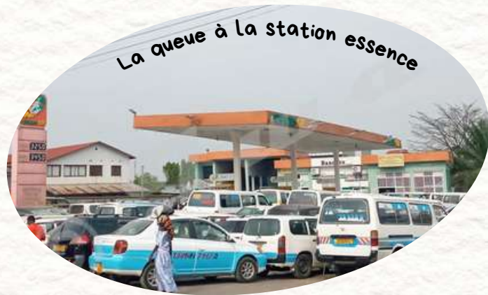
La queue à la station essence

Depuis plusieurs semaines, il y a une pénurie de carburant dans tout Bujumbura. Prendre le bus pour aller en mission, devient une épreuve de patience. Peu de bus circulent encore, beaucoup de gens attendent aux arrêts, il faut pousser des épaules pour entrer dans un. Nous attendons parfois plus d'une heure.