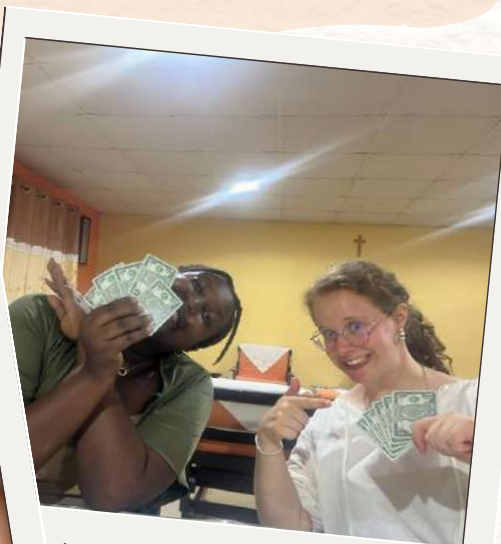
Une de nos multiples soirées jeux