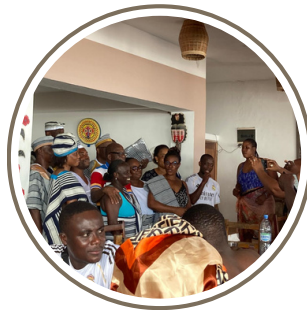
La séquence émotion/ remerciement du séminaire