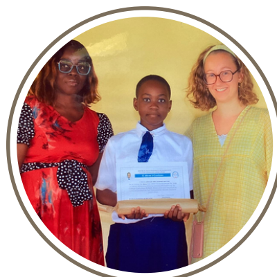
La remise des diplômes

Et si vous êtes plutôt vidéo, c'est par ici ou en scannant ce QR code