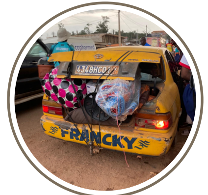
Un petit retour de marché