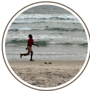
La mer !