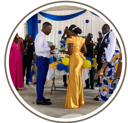
Le découpage du gâteau (avec un changement de robe pour la mariée)