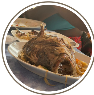
Un gros poisson