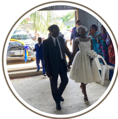
L'arrivée de la mariée accompagnée de son père au temple