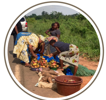
Un achat de mangues en bord de route (les meilleures)