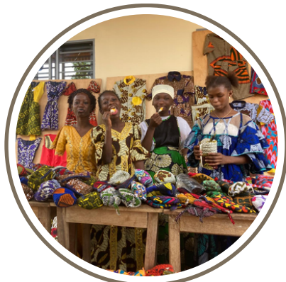
La vente de la couture d'arc-en-ciel en sortie de messe