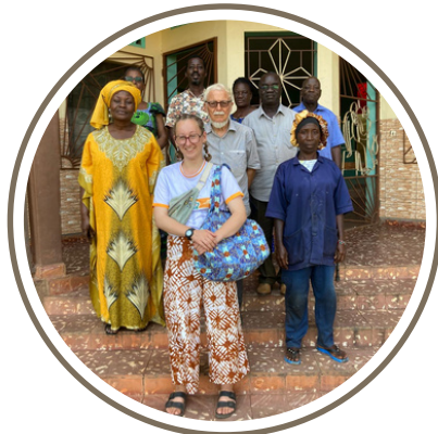
La photo de départ d'arc-en-ciel