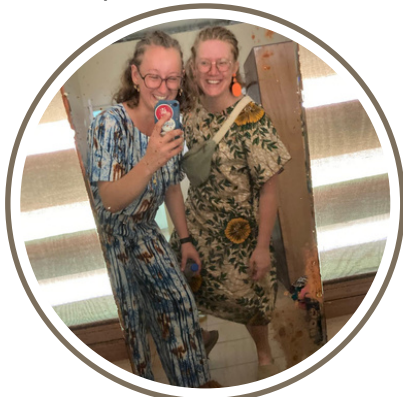
Sapées comme jamais pour la dot