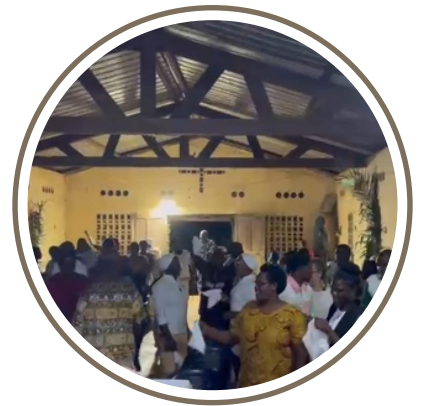
La sortie de messe où chacun y va agite ses mouchoirs et danse