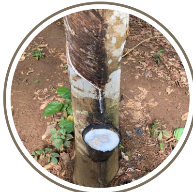
Un héréa (arbre à latex)