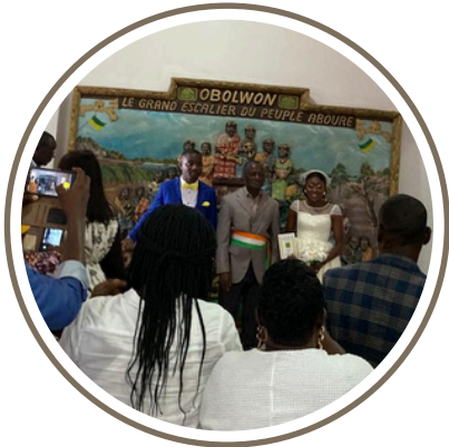
A la sortie de la mairie

protestante avait cuisiné pour tout le monde. L'ambiance était à la fête et à la joie pour célébrer "la victoire sur le célibat" avec un groupe qui jouait de la musique chrétienne. N'ayant aucun repère, je n'avais pas de comparaison possible, c'était, paraît-il, très simple avec des mariés qui se concentrent sur l'essentiel sans artifice.