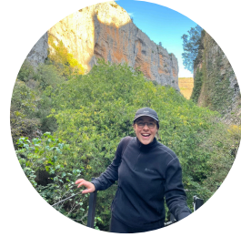
unterwegs in Alquézar