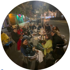
die ganze Terrasse der Bar voll mit Cartuja-Leuten

In dieser Woche haben wir uns intensiv mit dem Matthäusevangelium beschäftigt. Anhand ausgewählter Schlüsselstellen sind wir gemeinsam das gesamte Buch durchgegangen und haben dabei immer wieder Verbindungen zu anderen Teilen der Bibel hergestellt.