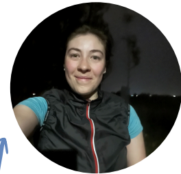
Mitte November bei 20° (und Wind)