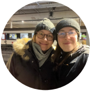
Abschied zum Zweiten