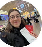
dieses Mal mit Boarding-Pass