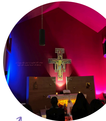
Gebetsabend bei uns im Haus für die 18-30-Jährigen