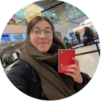
erster Versuch am Flughafen