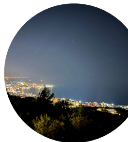
als ich am Abend ankam