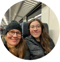
Abschied zum Ersten

Ich war am Flughafen und hatte bereits meine Koffer abgegeben, als ich nach langem Warten und Hin und Her schliesslich erfuhr, dass der Flug überbucht war. Ich war unfreiwillig die Auserwählte und konnte nicht wie geplant fliegen. So verbrachte ich einen weiteren Tag zu Hause, bevor ich ein zweites Mal von allen Abschied nehmen musste.