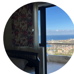
Aussicht von meinem Zimmer