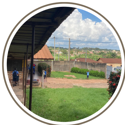
Cours de l'école