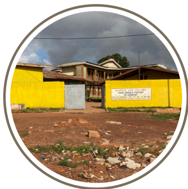
Devanture de l'école

Tous les lundis, je vais dans une école pour enfants qui ont tous types de handicaps, de l'autiste à l'estropié en passant par des sourds et muets. Ils ont entre 4 et 18 ans, les cours sont de niveau maternelle et primaire avec, pour certains, des cours de couture. Ici, chaque jour, des petits miracles s'accomplissent malgré le manque de moyens humains et financiers. Lorsque je suis là-bas, je suis dans la classe de primaire pour assister le professeur. Ils sont une quinzaine d'enfants âgés de 8 à 15 ans avec des niveaux et des handicaps très différents. C'est l'occasion pour moi de sortir du collège et de découvrir un autre fonctionnement. Pas de programme, simplement une alternance entre français et mathématiques rudimentaires, je dois gérer ma frustration, j'imagine déjà des comptines, du découpages et des ateliers Montessori, mais il faut s'adapter et faire avec les moyens du bord alors à moi, les crayons pour additionner et les ardoises pour écrire les jours de la semaine. Le maître de la classe a insisté sur l'amour qu'il fallait porter à chacun sinon ce métier n'est pas faisable, chaque leçon su est une victoire même si l'élève peut oublier dans la semaine.