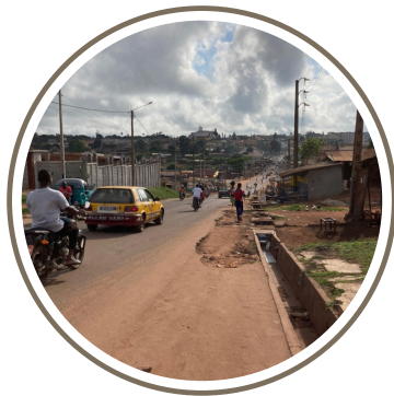
La route depuis le collège