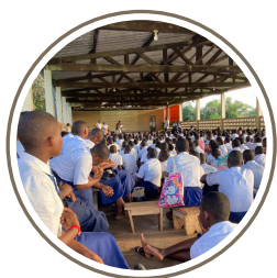
Présentation des clubs