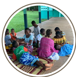
Un samedi après-midi