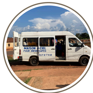
Camion de ramassage scolaire