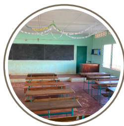
Une salle de classe