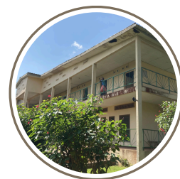
La maison Communautaire

Mes missions sont variées, je suis deux demi-journées par semaine de service à la maison. Le plus souvent, il s'agit de cuisiner ou d'aller au marché, c'est encore l'occasion de découvrir des manières de cuisiner et des ingrédients que je ne connaissais pas jusqu'alors. J'apprends à piler, à écailler les poissons et je me perfectionne dans la découpe des tomates, des concombres et des oignons. Ce sont surtout des temps d'échange que j'apprécie.