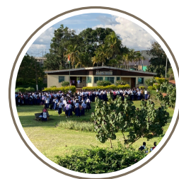
Un lundi matin lors du lever de drapeau