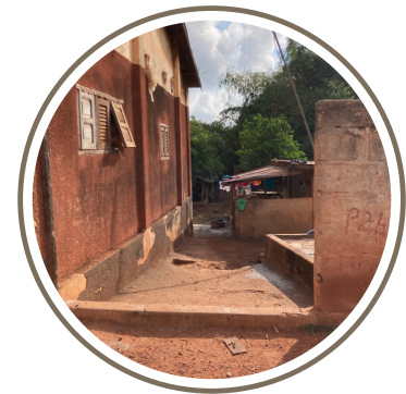
Vue d'une maison depuis la route