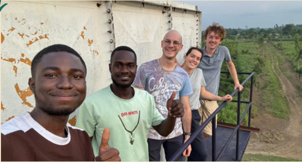
Photo en haut du forage de Menkao avec ma Frat

Sortie à la cathédrale de Kinshasa avec quelques uns de la maison