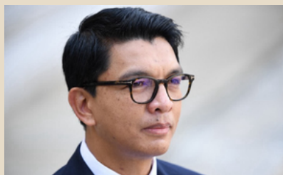
Andry Rajoelina (ancien président)

Un tournant a eu lieu lorsqu'une brigade d'élite, dirigée par le colonel Michaël Randrianarisoa, a refusé de réprimer les manifestants et s'est opposée au pouvoir en place. Le président Andry Rajoelina a alors fui le pays à bord d'un avion militaire français (grâce notamment à sa double nationalité franco-malgache). Un pouvoir temporaire a été mis en place pour 18 à 24 mois, avec le colonel Randrianarisoa comme président.