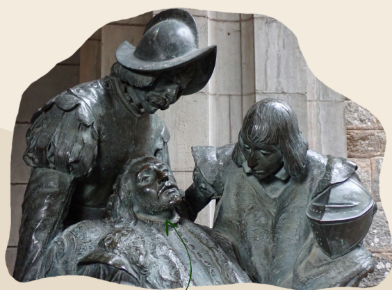
Saint Ignace c'est lui

La communauté du Chemin Neuf a été fondée par un prêtre jésuite. Les jésuites sont les membres d'une communauté religieuse fondée en 1540 par saint Ignace de Loyola . Une grande partie de la spiritualité du Chemin Neuf est empruntée à celle de saint Ignace.