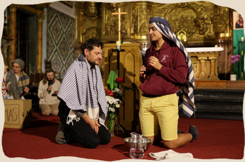
Ananias qui ouvre les Yeux de Paul Pièce de théâtre lors de l'office des enfants.

Cette rencontre l'obligea à relire la croix autrement : le Christ n'est pas maudit par Dieu ; il a librement porté la malédiction pour nous en libérer.