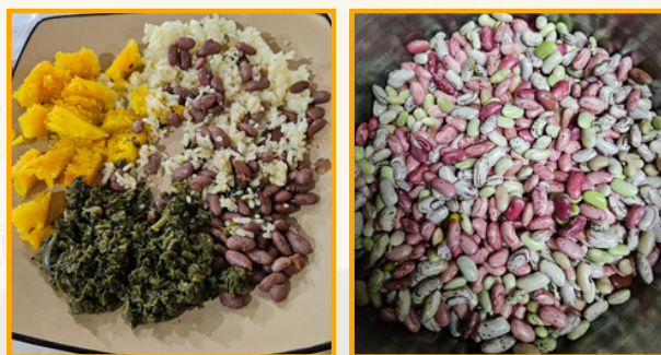
Haricots, courge et feuilles de courge du jardin !

A la maison, nous avons commencé la culture de plusieurs légumes et notamment les petits haricots ! J'ai été impressionnée par la quantité récoltée ! A un moment, nous en avions toujours qui attendait qu'on les épluche ! Je crois avoir trouvé la technique efficace pour ça...! Je les ai trouvés très beaux !