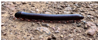
Nos amies les bêtes