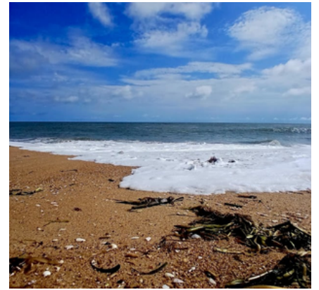
Dans le Bacca