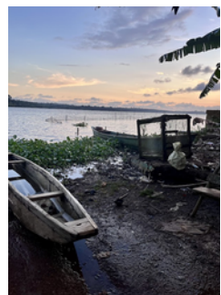
Vue du Village de Liboli