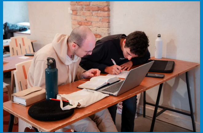
Je fais croire que j'étudie et que je travaille