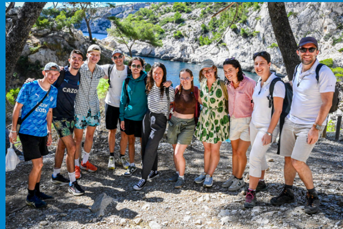
Sortie dans les calanques