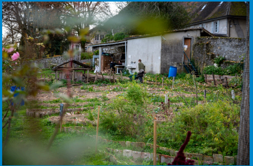
Le potager et un habitant inattendu de la forêt