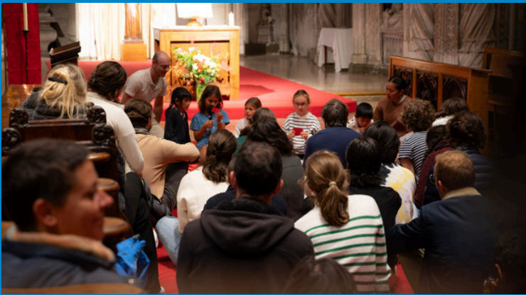
Office des enfants