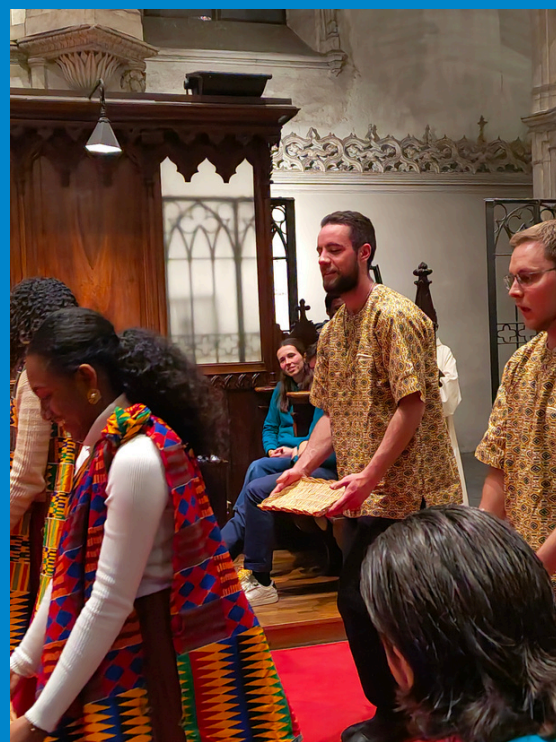
Procession des offrandes dansante

J'ai pu avoir des doutes pour la mission, mais le Seigneur est toujours venu me confirmer, particulièrement durant la retraite en silence des exercices selon St Ignace pendant laquelle j'ai vraiment compris que ma place était à Kinshasa, auprès des enfants, qu'ils m'attendaient là-bas et que c'était temps pour moi de quitter la formation et d'aller vivre et expérimenter dans le concret ce à quoi j'avais été appelé et ce pour quoi j'ai été fait.