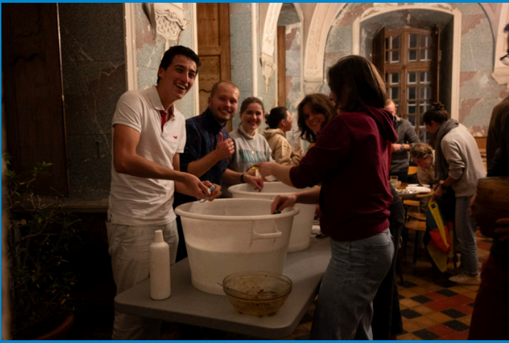
La vaisselle après les repas, toujours un grand moment !