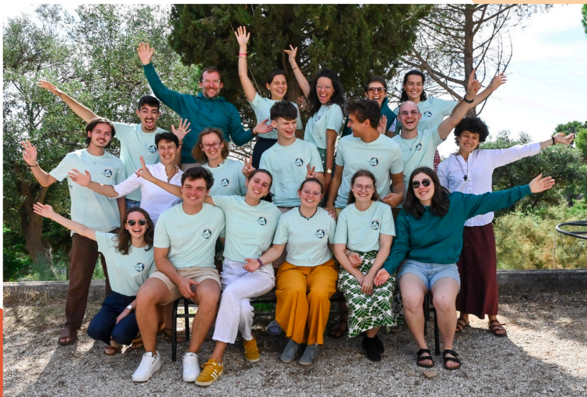
PHOTO DE CLASSE DE LA PROMO JET 2025-2026

Il était temps pour nous de replonger dans le cœur de notre mission après ces longues vacances et ces deux dernières semaines de préparation, surtout occupées à attendre derrière le téléphone qu'un aimable conseiller d'une des nombreuses agences de notre chère administration française daigne nous faire don d'un renseignement souvent approximatif et parfois erroné.