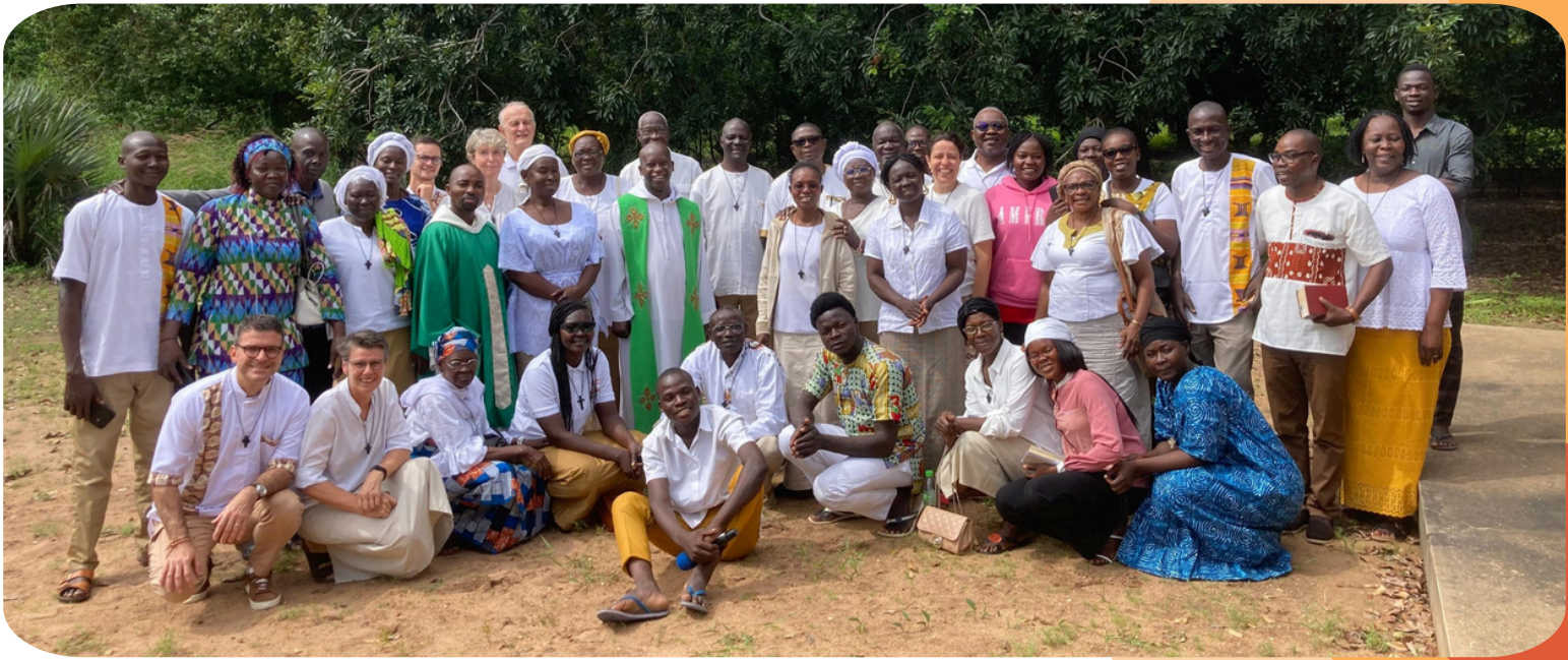
PHOTO DE CLASSE 2025

Pour aider dans la lutte contre la pauvreté, la Communauté s'est également engagée dans le domaine de la santé et de l'éducation scolaire sur le secteur de Ku-Jéricho, en y construisant une école et un centre de santé.