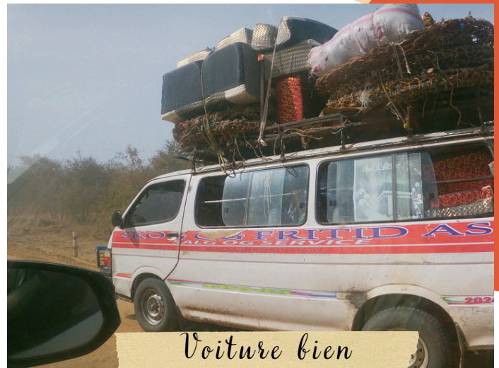
Voiture bien chargée