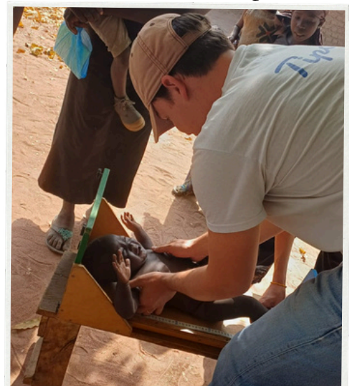
On pleure parce qu'on a peur des blancs