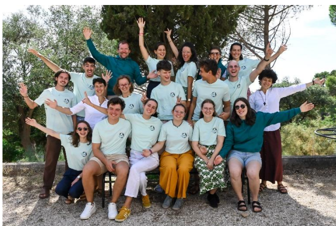
Promo JET 2025-2026

C'était une semaine fraternelle très riche de formation et d'adaptation à la vie communautaire et à la spiritualité de la communauté.