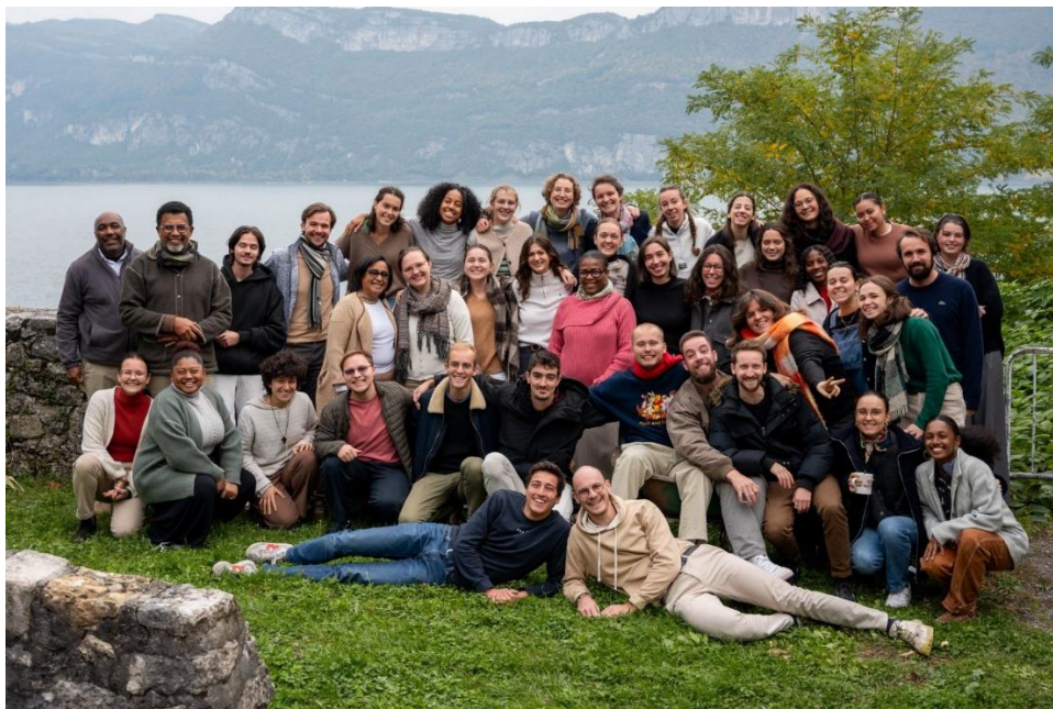
Promo HDS 2025-2026 – Semestre 1

A partir de fin septembre, j'ai intégré cette belle formation HDS jusqu'à mi-décembre, soit 11 semaines. La formation HDS signifie « Hautecombe Discipleship School », elle a pour but de former chaque année une cinquantaine de jeunes qui veulent Être disciple du Christ. Les trois piliers de la formation sont : la formation biblique et théologie, la prière et le discernement, et enfin la vie communautaire et interculturelle.