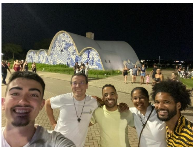
Photo devant l'église St François d'Assise à côté du « Lagoa da Pampulha », un lac artificiel réputé

Cette période à Divinópolis a été marquée par la prépa et le festival « Summer Camp ». C'est un festival chrétien principalement pour jeunes entre 14 et 18 ans mais il avait aussi quelques jeunes entre 18 et 30 ans au service. Ce festival a vraiment été une belle grâce car j'ai été témoin de belles rencontres avec Jésus chez les jeunes et de beaucoup d'expériences fortes !