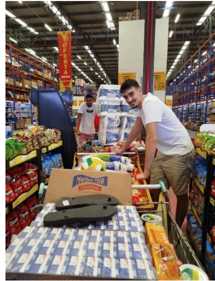
Courses pour le festival (quatre chariots remplis)