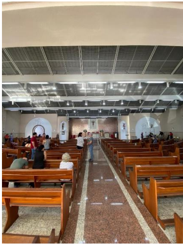
Église ST Christophe à Divinópolis