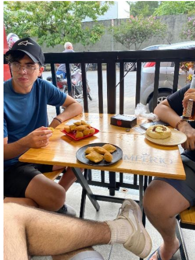
« Padaria » (l'équivalent d'une boulangerie en France)