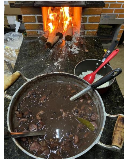
« feijoada » : plat typique du Brésil hérité de l'esclavage