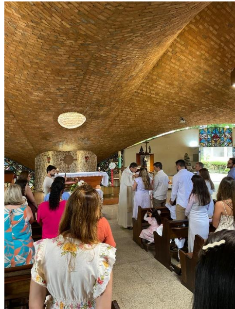
Baptême dans l'église mère (appelée aussi « église du chapeau »)

La mission qui ne s'arrête pas et à laquelle j'ai pu participer est l'ASOMAR !! Cette mission consiste à distribuer des paniers basiques de nourriture aux familles pauvres du quartier chaque premier samedi du mois. L'objectif par la suite serait d'aller à la rencontre de ces familles.