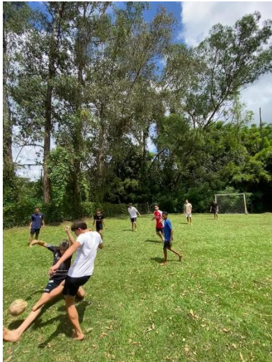
Premier foot avec les brésiliens (ils sont bons)