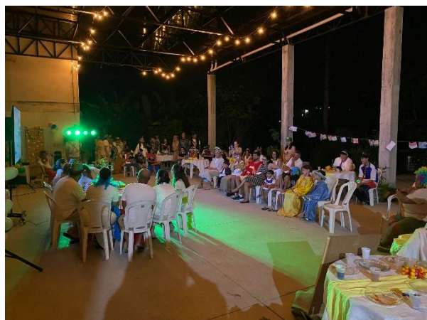
Fête du Carnaval à Divinópolis