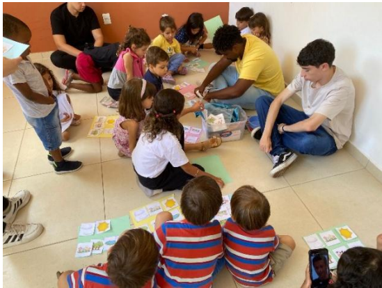
Service pendant « Cana Day » avec les 4 à 6 ans