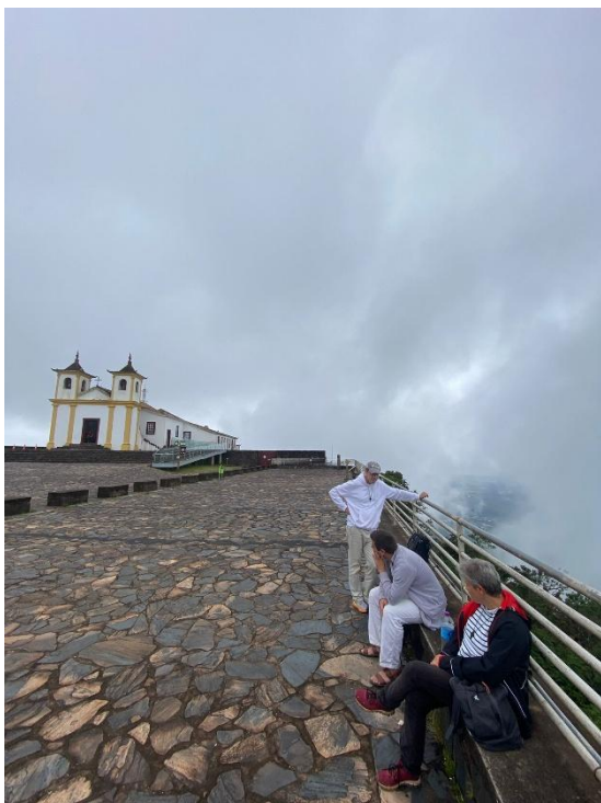
Journée maison au sanctuaire « Nossa Senhora da piedade »