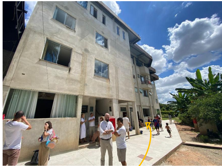
Maison de retraite de Divinópolis

La semaine communautaire est un rassemblement annuel de tous les communautaires du Brésil et discernements pour devenir communautaire. Ils se rassemblent une semaine pour vivre des temps spirituels, fraternels, de service et de formation tous ensemble.