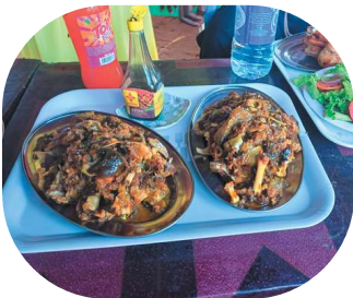
Au menu, tête de chèvre (sur la photo) Puis une nouvelle découverte culinaire : le bazo (pénis de boeuf), j'avoue ne pas avoir été très convaincue