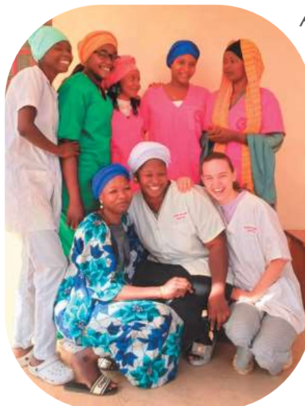
Avec les infirmières et stagiaires