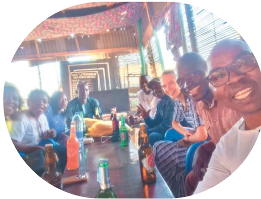
Petit verre avec l'équipe du centre pour fêter mon départ et deux anniversaires Ici on boit rarement une seule boisson mais plutôt 2 ou 3