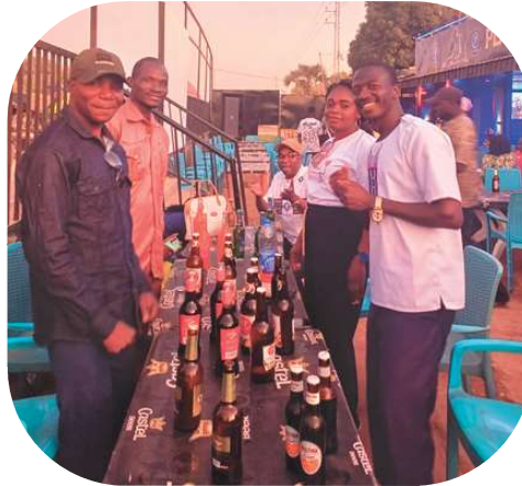
Et on danse !