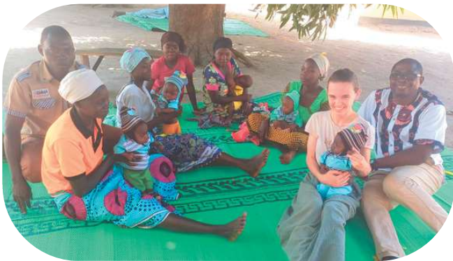
Des triplés à qui nous donnons du lait au centre