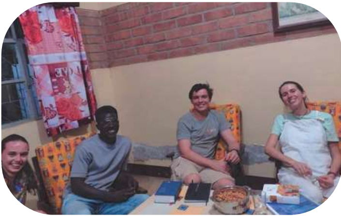
Notre dernière frat