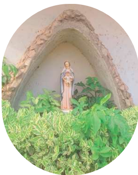
La statue de Marie à l'entrée de la maison, devant laquelle j'aimais beaucoup prier

Le deuxième aspect principal est la vie de prière, que j'avais hâte de vivre en partant. La messe quotidienne, les offices, l'adoration m'ont vraiment nourrie et me manquent. Le mardi était souvent mon jour préféré de la semaine avec le temps de désert où j'avais toute la matinée pour prier. C'était vraiment un cadeau pour poser un peu tout ce que je vivais, le remettre à Dieu et me regonfler de paix et de joie dans les moments plus difficiles. J'aimais participer à la beauté de la liturgie en préparant l'office ou la messe et j'ai été heureuse d'y vivre l'Avent et le Carême.