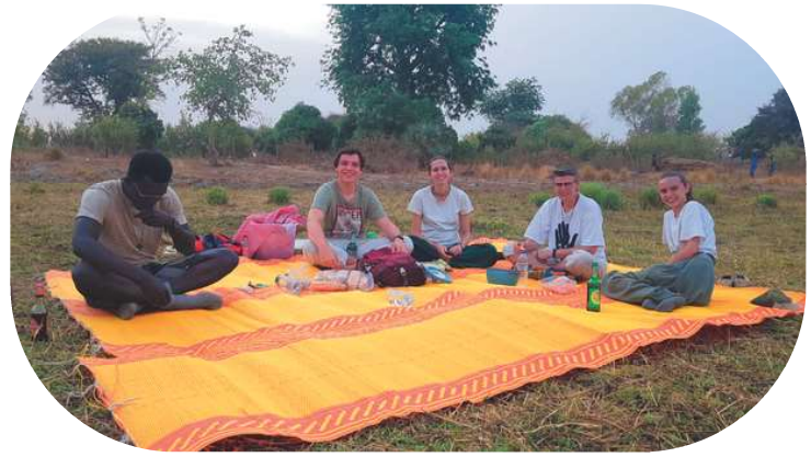
Petit pique-nique au bord du lac (concept de blancs, tous les enfants des alentours nous regardaient avec de grands yeux )