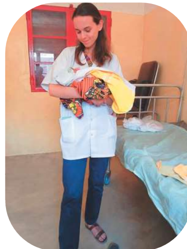
Naissance à la maternité