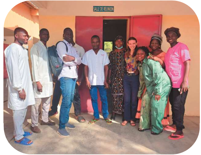
Et le dernier jour au centre !