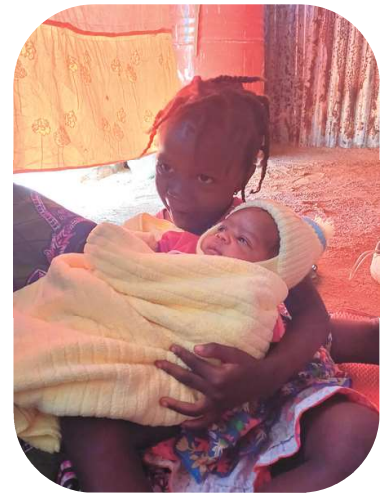
Et la grande soeur