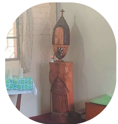
Le tabernacle de l'oratoire

Viens ensuite bien sûr la mission, qui a pris une grande place pendant ces 4 mois. J'ai eu la chance d'avoir des missions dans lesquelles je me suis rapidement sentie à l'aise, à ma place, et où je me suis sentie utile, que ce soit au centre ou à l'école. J'étais vraiment heureuse de pouvoir exercer mon métier, de toucher le quotidien de la vie au village à travers toutes les rencontres, de partager des discussions et moments de vie avec mes collègues.