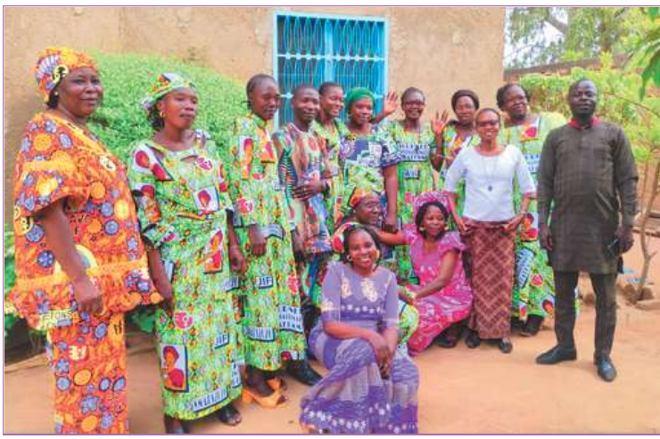
Repas des enseignantes (la plupart portent le pagne de la journée de la femme 2026)