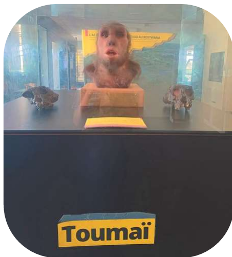
Reconstitution du buste du plus ancien humain connu, retrouvé au Tchad