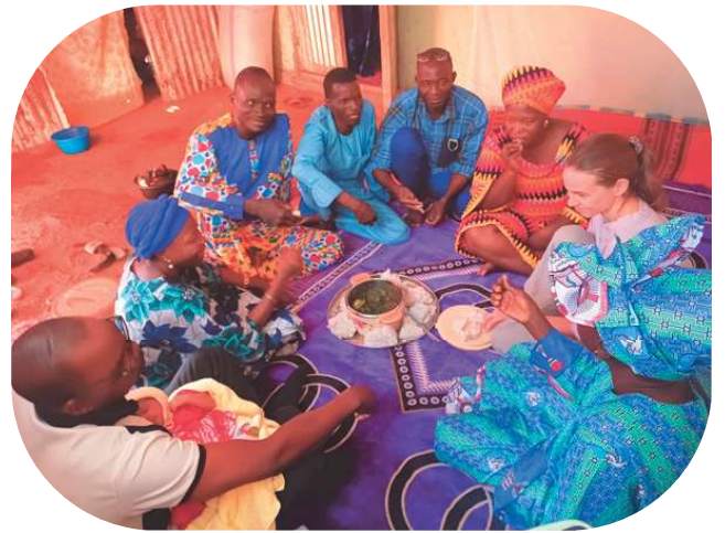
On partage la boule à toute occasion