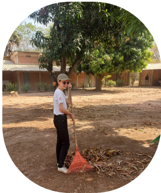
Vu la quantité de feuilles qui tombent on peut recommencer toutes les semaines 😊

Au centre de santé, nous continuons les journées de dépistage mensuelles de la dénutrition dans les villages et j'ai fini la visite médicale de tous les enfants de l'école !