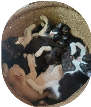
Les petits chatons qui grandissent devant la porte de ma chambre 🍷