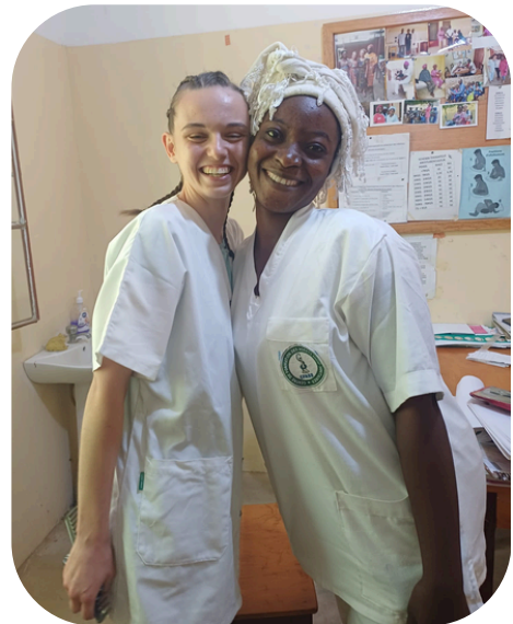
Avec Mirabelle, stagiaire du centre, qui a participé à me tresser les cheveux