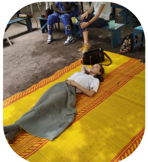
Pas désagréable la journée détente !