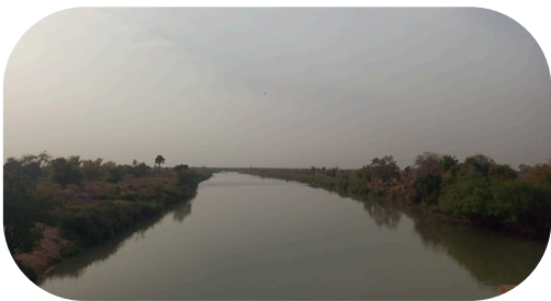
Sur la route vers Doba

Cœur de l'Afrique et terre de contrastes, le Tchad est un vaste État d'Afrique centrale, souvent surnommé le "Cœur mort de l'Afrique" en raison de sa position centrale et de son enclavement. Ex-colonie française ayant pris son indépendance depuis 1960, c'est le cinquième plus grand pays du continent, couvrant 1 284 000 km 2 . Sur la carte, il se situe au carrefour de l'Afrique du Nord et de l'Afrique subsaharienne, bordé par six voisins : la Libye au nord, le Soudan à l'est, la RCA au sud, et le Cameroun, le Nigeria et le Niger à l'ouest. Sa géographie se divise en trois zones climatiques : le Nord saharien (aride et montagneux avec le massif du Tibesti), le Centre sahélien (steppes) et le Sud soudanien (savanes fertiles et humides). Le pays connaît deux saisons principales : une saison sèche (octobre à mai) et une saison des pluies (juin à septembre), dont l'intensité varie du nord au sud.