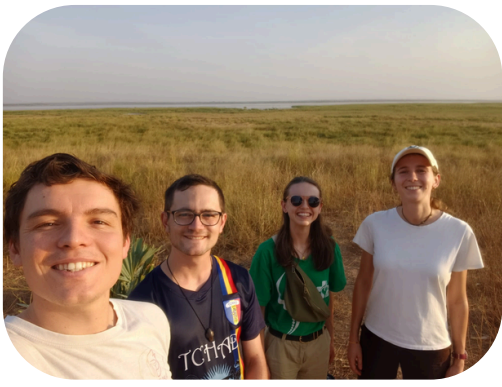
Balade entre "Nassar" (blancs en ngambaye)