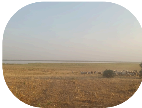
Au bord du lac Ouey