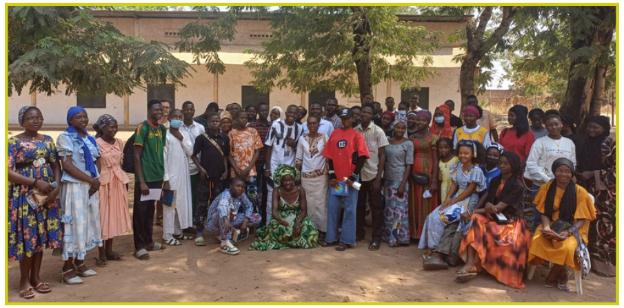
Journée sur la Parole de Dieu pour les 14/18 ans