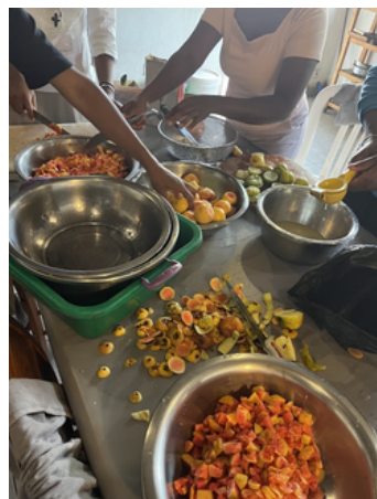
En pleine préparation de jus de goyave