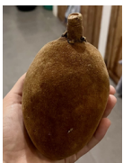
Fruit de Baobab