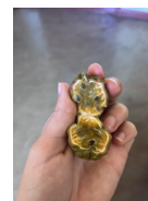
Fruit de la passion