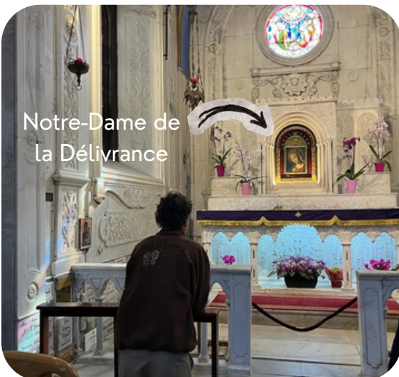
Notre-Dame de la Délivrance