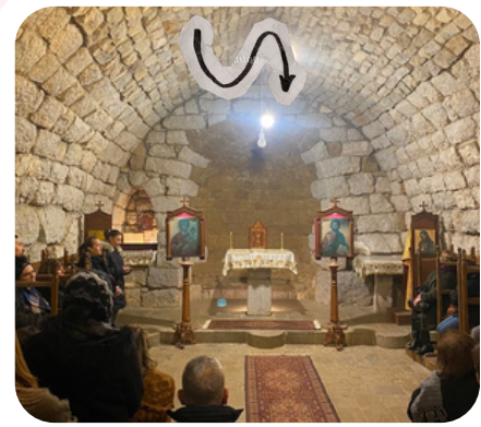
chapelle du monastère melkite