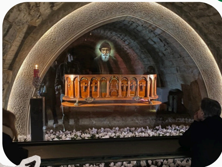
tombeau du saint

C'est justement à partir de 1950 que sont relatés au sein du monastère les nombreux miracles attribués à son intercession : 41 530 lettres sont écrites et envoyées entre 1950 et 1957 par des personnes n'ayant pas le même horizon religieux (chrétiens, musulmans, druzes, et même des athées...) à destination du monastère pour témoigner de guérisons médicalement inexplicables, telles que des guérisons soudaines de cancers, de paralysies ou de maladies pourtant jugées incurables. Aujourd'hui, les archives du monastère Saint-Maroun à Annaya enregistrent plus de 30 000 miracles (dont plusieurs centaines certifiés médicalement), ce qui fait de saint Charbel le saint qui, dans l'Eglise catholique, décompte le plus de miracles à son actif !