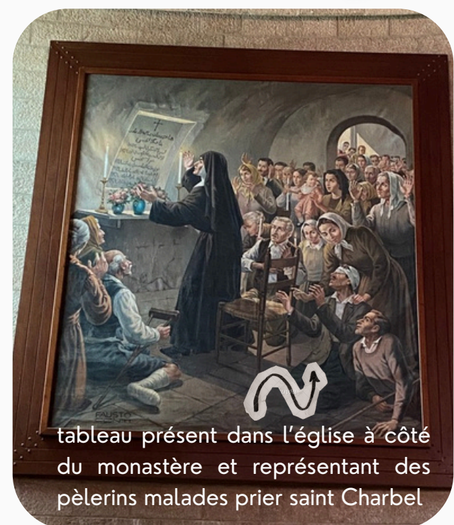
tableau présent dans l'église à côté du monastère et représentant des pèlerins malades prier saint Charbel

Elie, Mirna, Sarah et moi-même sommes montés en premier lieu à l'ermitage, où Frère Charbel vivait dans une cellule de six mètres carrés, avec une absence totale de confort. L'ameublement était en effet composé d'une paille, d'une cruche d'eau, d'une minuscule lampe à huile, d'une écuelle de bois sur un tabouret et d'une simple pierre servant de siège. Aussi ne dormait-il que trois heures par nuit sur son "matelas" qui était en fait un feuillage de chêne couvert d'une paille, et son "oreiller" une pièce de bois enroulée dans un lambeau de soutane ! C'est ici qu'à travers le silence, la solitude et l'extrême pauvreté, Charbel Makhlof ouvrait son âme au souffle de l'Esprit-Saint, laissant demeurer en elle une paix intérieure considérée comme le "vestibule" de la contemplation dans la tradition mystique de l'Ordre maronite. Après être descendus au monastère pour assister à la messe célébrée par un moine-prêtre, nous nous sommes recueillis de longues minutes devant le tombeau de saint Charbel pour prier et lui demander la guérison de nos douleurs, nos souffrances, nos blessures, surtout celles qui sont enracinées profondément dans chacun de nos cœurs et dont nous sentons qu'elles nous pèsent comme un fardeau, au point de nous empêcher d'être pleinement heureux, pleinement comblés en Dieu.