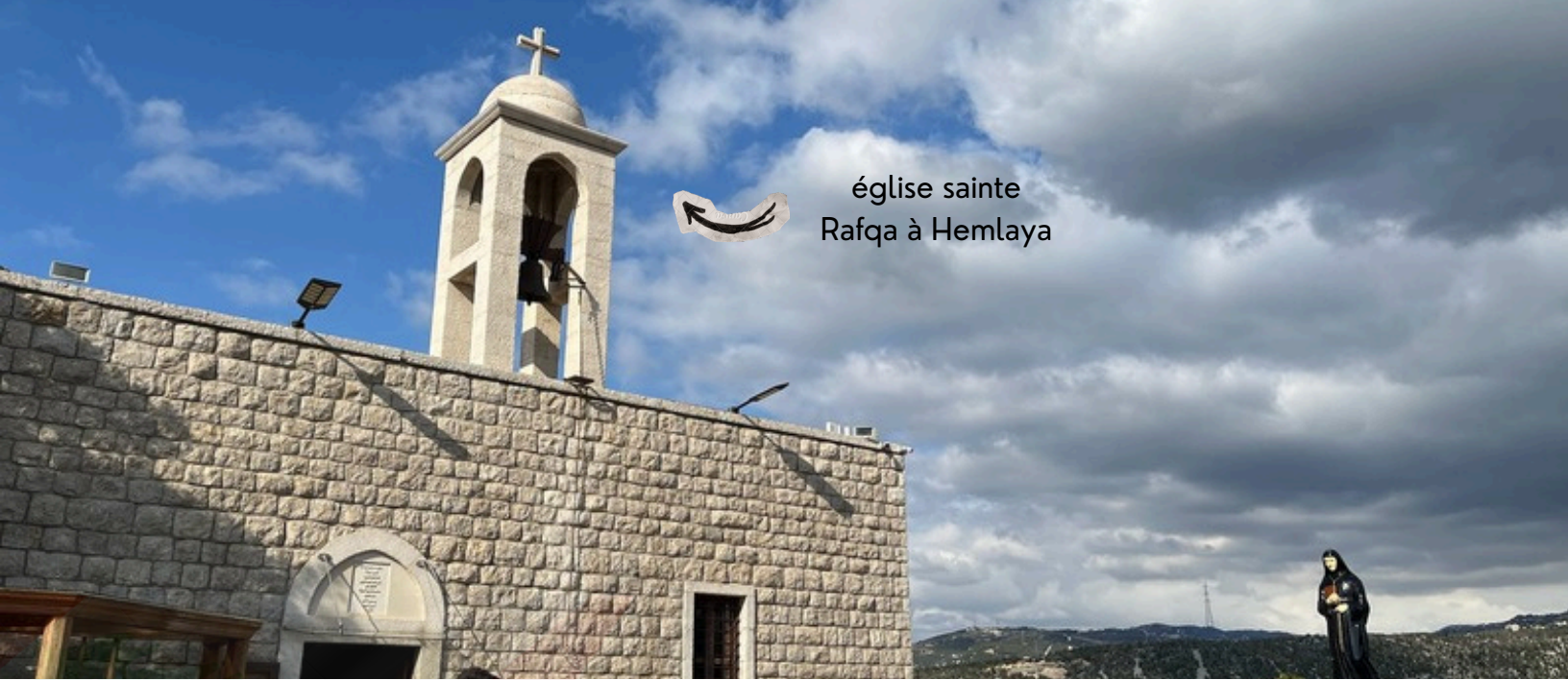
église sainte Rafqa à Hemlaya