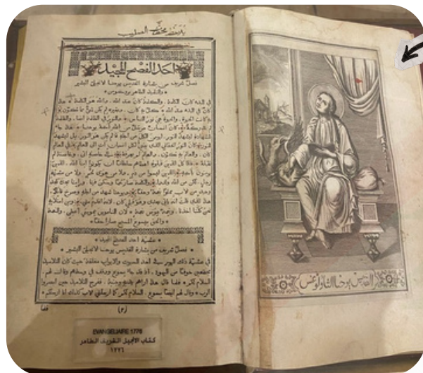
livre liturgique datant du XVIIIème siècle écrit et imprimé en arabe littéraire au musée du monastère saint-Jean