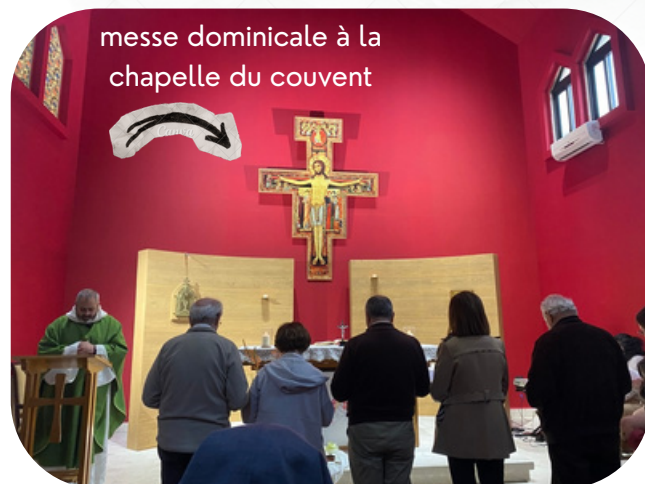
messe dominicale à la chapelle du couvent

J'ai d'ailleurs quelque peu ressenti la tension mêlée à de la résignation qui habitait le cœur des Libanais que j'ai rencontrés durant ce mois de mars, tant ils sont habitués depuis des années à ce que leur petit pays subisse d'aussi grandes attaques. Le groupe de prière du mardi soir a pris plus de place et d'importance, car de l'extériorisation de cette tension en la confiant à Dieu découle une libération intérieure, celle du fardeau de la guerre qui pèse si lourd sur les épaules de chaque Libanais (territoires attaqués ; écoles qui ferment, prix au supermarché qui décuplent concomitamment à beaucoup d'entre eux qui ne peuvent plus travailler, et alors même que le niveau de vie est déjà peu élevé ; angoisse constante liée à l'horizon peu plausible d'une paix durable...).