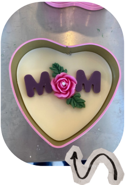
Cœur en cire pour la fête des mères