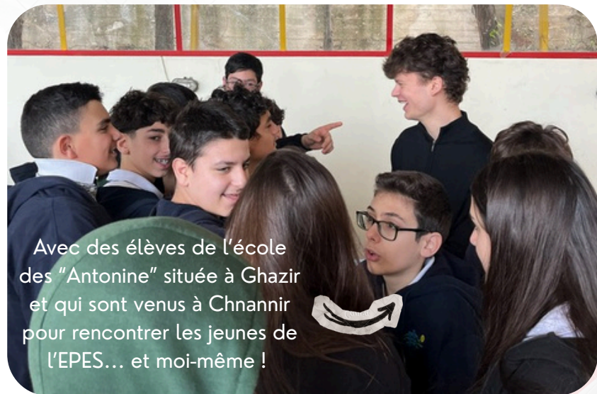
Avec des élèves de l'école des "Antonine" située à Ghazir et qui sont venus à Chnannir pour rencontrer les jeunes de l'EPES... et moi-même !

En résumé, le mot-magique du carême est "PERSÉVÉRANCE" (ce n'est pas pour rien que Jésus dit à Pierre "C'est par votre persévérance que vous obtiendrez la vie" en Luc 21,19). Toutefois, il n'en demeure pas moins que persévérer quand on est esseulé est bien difficile, puisque nous pouvons vite céder à la tentation, au découragement, à cette pensée vaine qui nous ronge selon laquelle notre faiblesse d'être-humain est bien trop puissante pour surpasser le seuil des obstacles aux allures de montagnes qui se dressent en face de nous. C'est pourquoi le carême, ce temps de "conversion du cœur" ne doit pas se vivre seul, mais avec d'autres : un ami, un frère, une soeur, voire en communauté, comme ce fut mon cas. Si je n'avais pas été porté par cette vie communautaire où s'entremêlent au quotidien des moments fraternels de prière, de partage et de renoncement à soi-même, j'aurais inévitablement eu beaucoup plus de (mal)chance de flancher et de désespérer. Mais c'était aussi en vue de ce "carême communautaire" que je suis parti en mission avec la Communauté du Chemin Neuf , laquelle a d'ailleurs pris un tournant lorsque la guerre est venue déposer son gros grain de sel sur le pays du Cèdre.